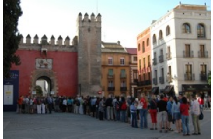
Fuente: Fila para acceder a los Reales Alcázares de Sevilla. Fotografía de C. Hiriart, 2008.

(ICOMOS), así como en el seno de la Organización Mundial de Turismo, entre otros”. (Hiriart, 2013, p.31)