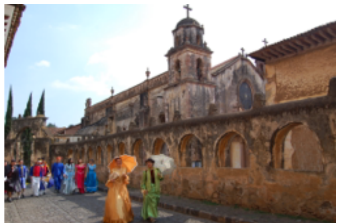
Recreación de "época" para el turismo en Pátzcuaro Michoacán. Fotografía de Eduardo Quintana M., 2013.

En esta Sección, se abordan las características y problemáticas específicas del patrimonio monumental y la gestión del turismo cultural en el Estado de Michoacán, y como ya se ha referido antes, pone especial atención en la ciudad de Morelia, con su Centro Histórico, y en Pátzcuaro, con su Zona de Monumentos Históricos decretada desde 1990. En el capitulo de esta parte se, evidencia con claridad la riqueza, diversidad y singularidad patrimonial del Estado, tanto material como inmaterial. También se plantean los desafíos que se tienen en pleno siglo XXI para construir un nuevo proyecto de desarrollo sustentado en los recursos patrimoniales, haciendo referencia a la relación que se estableció desde los años treinta del siglo XX,