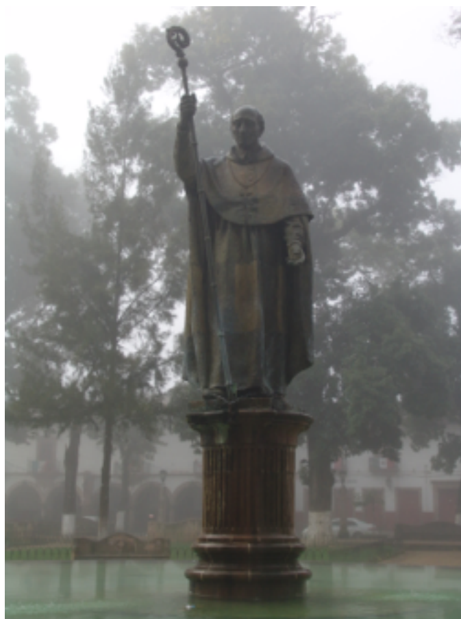
Fuente: Plaza Vasco de Quiroga, Pátzcuaro Michoacán, México. Fotografía de C. Hiriart, 2006.

la lista del patrimonio mundial inmaterial y el patrimonio natural como la reserva de la Mariposa Monarca, constituyen algunos de los valores y recursos representativos con los que Michoacán contribuye a la herencia de toda la humanidad. Además, para el contexto nacional posee ocho poblaciones históricas en la categoría de Pueblos Mágicos , importantes zonas arqueológicas que conforman un patrimonio prehispánico y un sinnúmero de festividades y tradiciones que muestran y recuerdan las costumbres ancestrales y el sincretismo cultural que ha distinguido al pueblo michoacano.