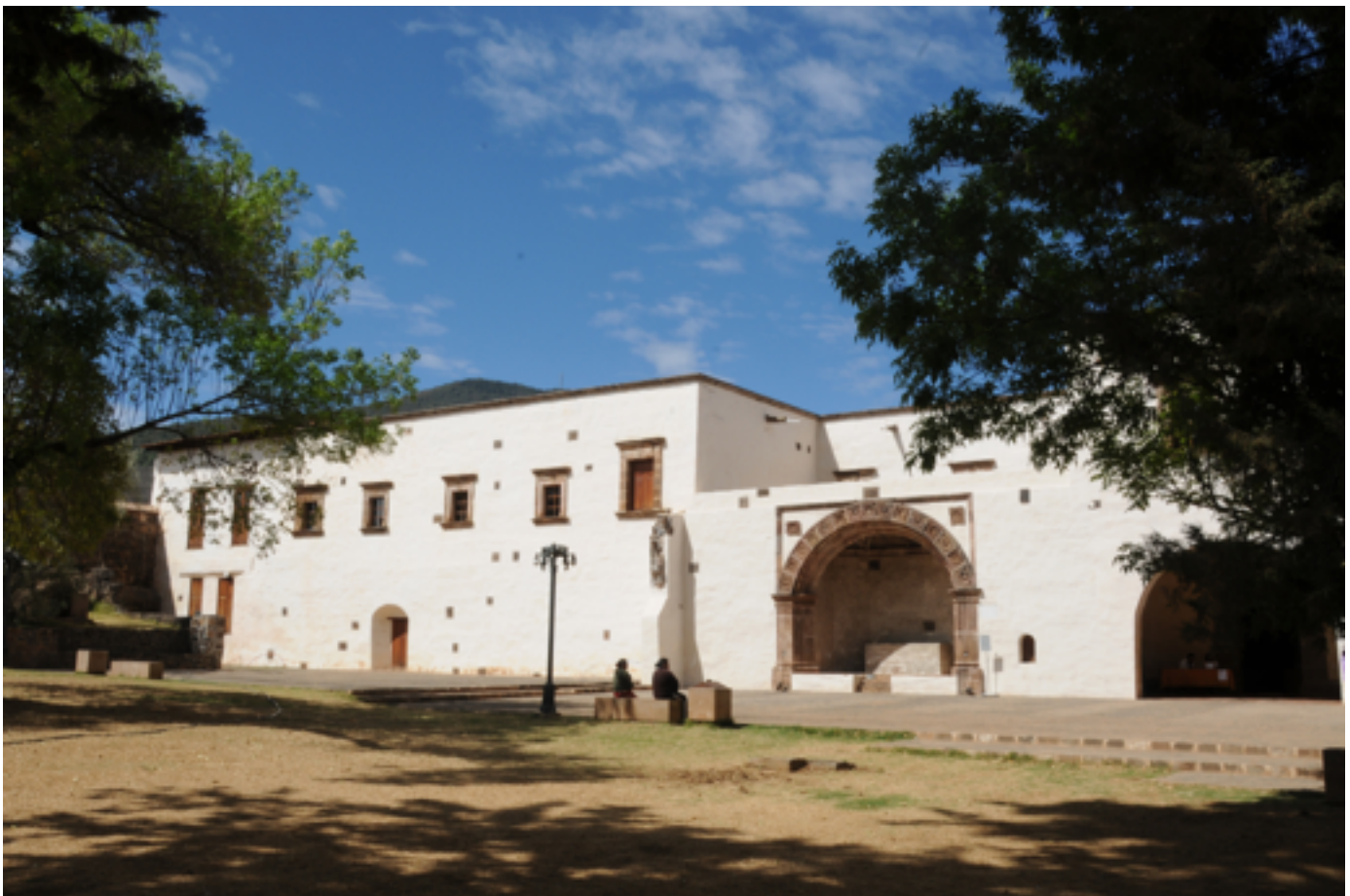
Fuente: Atrio y capilla abierta del Convento Franciscano de Tzintzuntzan, Michoacán, México.

Considerando varios de los aspectos antes señalados, esta obra editorial inicia con la convicción de que la herencia cultural y natural de México y de Michoacán no puede considerarse como un patrimonio sesgado o indiferente a los procesos de desarrollo socioeconómico de los municipios y poblaciones del Estado, por lo cual se debe estamos convencidos de que el turismo puede ser una herramienta eficaz para el desarrollo a corto plazo de Michoacán y que si se promueve de forma sustentable y equilibrada, no sólo contribuye a la conservación de los recursos culturales y naturales, sino que genera empleos, principalmente para los jóvenes que demandan mayores oportunidades de progreso