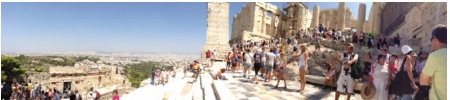
Fuente: Acrópolis en Propileos, Atenas, Grecia. Fotografía de Carolina Martínez, agosto 2013.