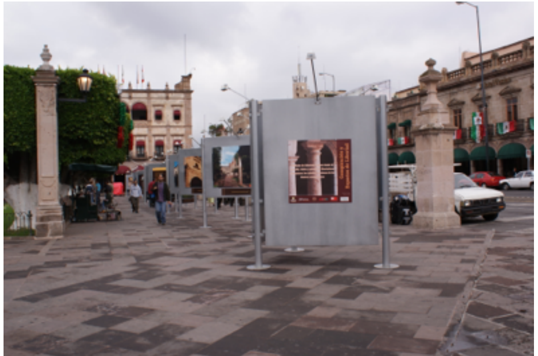
Fuente: Exposición cultural en el Centro Histórico de Morelia. Fotografía de C. Hiriart, 2009.

patrimonio urbano arquitectónico por sus potencialidades de uso como recurso turístico y por el papel que juegan frente a la sociedad, en el marco de las propuesta de desarrollo social y económico que están planteando las políticas públicas de la gran mayoría de los países en contexto global, en Latinoamérica y particularmente en México, que actualmente ocupa en el ranking de la OMT la posición número quince entre los principales destinos receptores de turismo en el mundo.