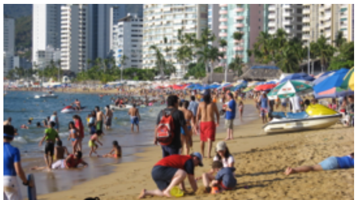
Fuente: Turismo masivo de sol y playa. Acapulco México, diciembre del 2009. Fotografía de C. Hiriart, 2009.

informó que el número de turistas internacionales viajando alrededor del mundo en el año 2014 fue de 1,138 millones (UNWTO, 2015), superando los 1,087 millones que se desplazaron globalmente en el año 2013 (UNWTO, 2014) y mostrando siempre su permanente capacidad de recuperación, que generó en el mercado internacional ingresos por más de 1.19 billones de dólares EE.UU., en 2013 (UNWTO, 2015)