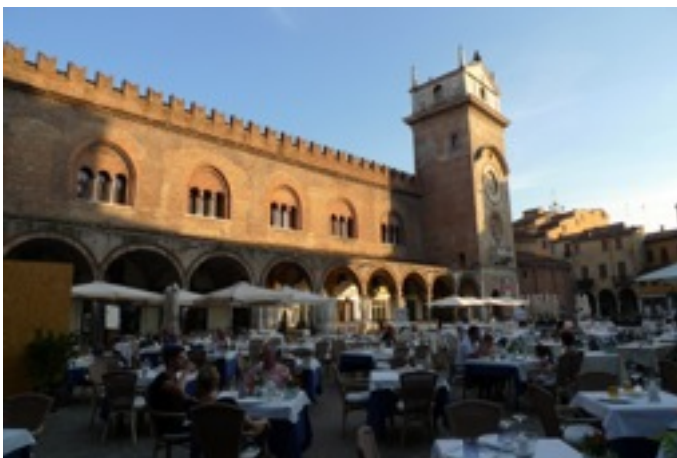
Fuente: Ocupación de la plaza Delle Erbe en Verona, Italia. Fotografía de Carmen Mínguez, 2013a

“el verdadero valor de estas investigaciones se encuentra en la posibilidad de que las aportaciones que de ellas se generan y los resultados obtenidos sean difundidas ampliamente y puedan contribuir para apoyar las políticas públicas que vinculan el desarrollo turístico y la conservación del patrimonio edificado de Michoacán, en el marco de su manejo sustentable como recurso turístico, atendiendo así las diversas recomendaciones que se han venido planteando en el Consejo Nacional de Legisladores en Materia de Turismo (CONLETUR), el Gobierno Federal a través de la SECTUR, en los trabajos de las Comisiones de Turismo y Desarrollo Urbano Obra Pública y Vivienda de la LXXII legislatura del Congreso del Estado de Michoacán, en los programas estratégicos del Gobierno de Michoacán, la UNESCO y el Consejo Internacional de Sitios y Monumentos