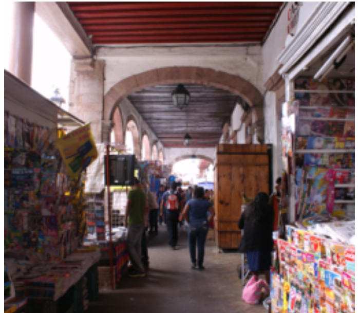
La presencia del comercio informal en los portales y en la Plaza Gertrudis Bocanegra de Pátzcuaro. 2013.

En el capítulo sobre Pátzcuaro, a partir del reconocimiento de la ciudad histórica como parte de uno de los paisajes culturales más